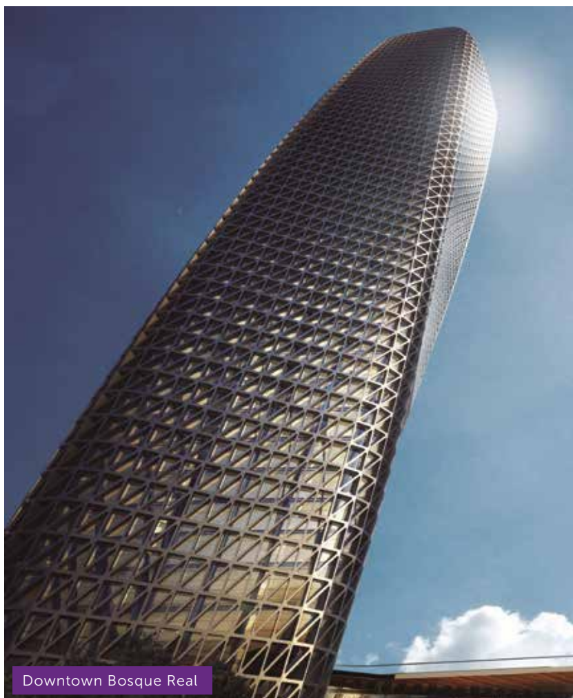
Downtown Bosque Real

El diseño de exitosos proyectos en más de 15 países, solamente son el reflejo de las necesidades y la satisfacción de sus clientes. La firma logra contribuir con el cumplimiento de las metas y objetivos de sus clientes yendo de la mano con ellos desde el primer momento, trabajando en equipo, generando valor por medio del diseño para la consecución de la realización de una visión en conjunto.